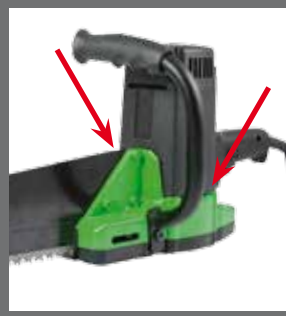
Рукоятка, устанавливаемая на обеих сторонах